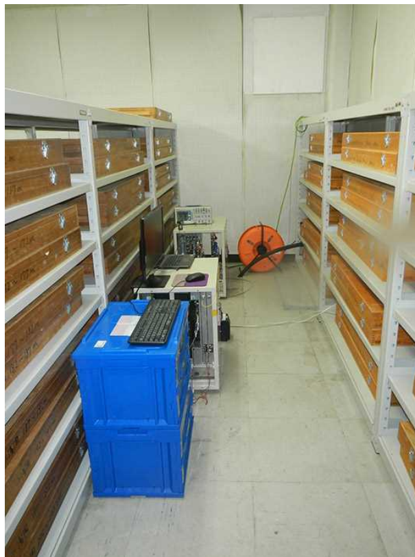
写真 2. 浅間火山観測所本館内における光送受信機設置状況