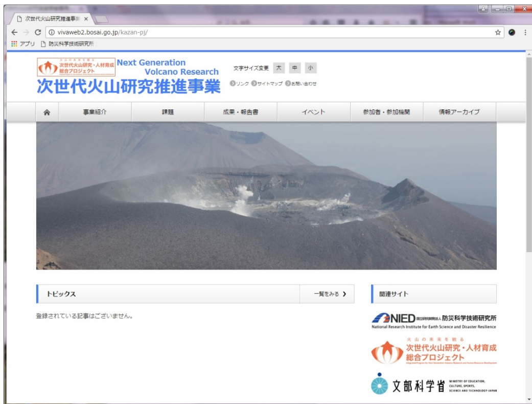
次世代火山研究推進事業専用ホームページ